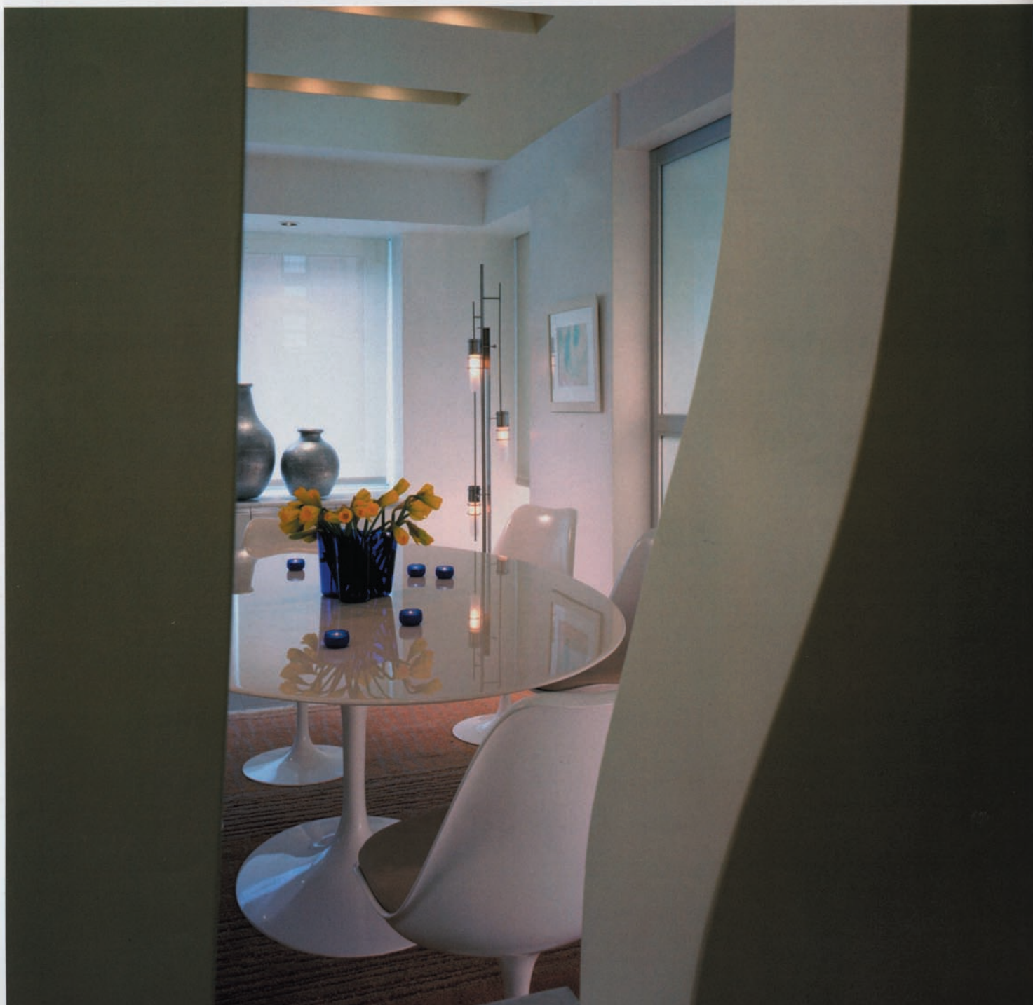
Texto :: Text · Alexandra Novo

This Park Avenue loft-apartment, not unlike a giant sculpture, has been bestowed with the glamour of Art Deco. Here, with the aid of contemporary design, art is conjugated in the present tense.